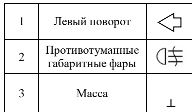
Рис.2. Схема подключения электрооборудования